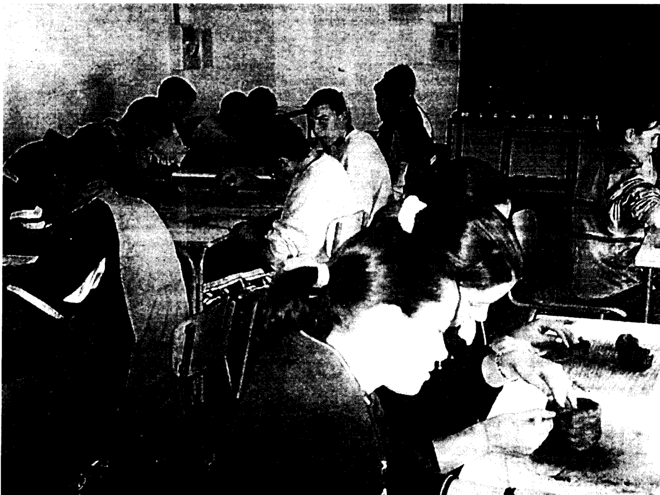
I. ALUMNOS Y ALUMNAS DEL IES PROFESOR TIERNO GALVÁN DE LA RAMBLA EN EL TALLER PLÁSTICO DEL MUSEO ALFONSO ARIZA. DIARIO CÓRDOBA. MIÉRCOLES, 17 DE MAYO DE 2000.